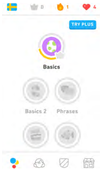
Abbildung 3: Startbildschirm der App „Duolingo“ mit Levelanzeige